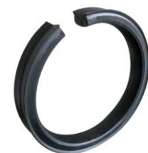
За неразглобяеми ролки на Poma съоръжения