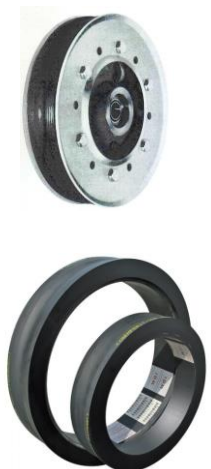
За разглобяеми ролки на лифтове Leitner и Doppelmayr