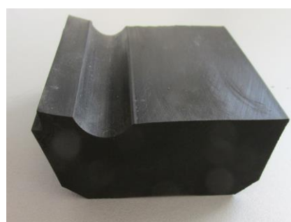
Масивни гумени профили за задвижните и обръщателни станции на лифтовете