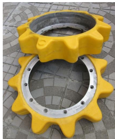
Рециклирани стари звездочки