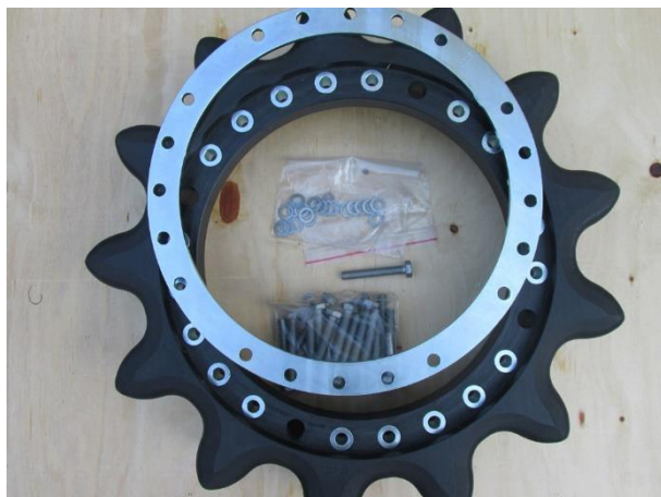
Доставка на комплект нови звездочки

За по-старите модели снегултъпкващи машини като PB 80, PB 100, PB 170-210, PB 240, PB 260 - Kässbohrer не произвежда вече тези резервни части. За да продължи експлоатацията на машините, остава единствената възможност - рециклиране на амортизираните след дълга употреба звездочки!