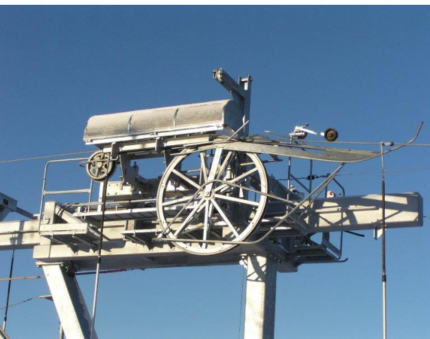
Влек с откачаеми теглички