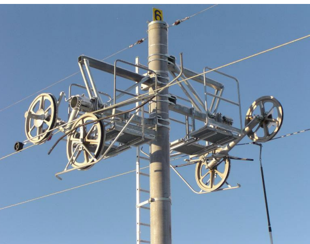
Влек тип Н