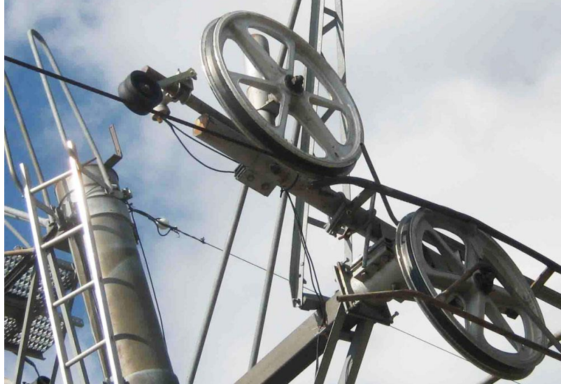
С фиксирана / плаваща обръщателна станция