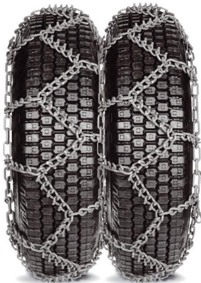
За двойни гуми модел SS/SS+8