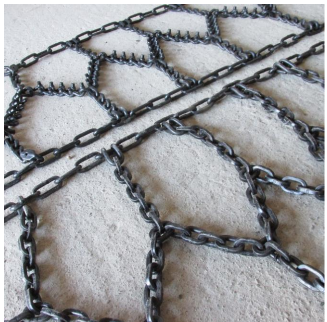
SS+8 усукан / SS-NK+8 квадратен синджир

* Моделите със заварени шпайкове може да се произведат без шпайкове - по предварителна заявка.