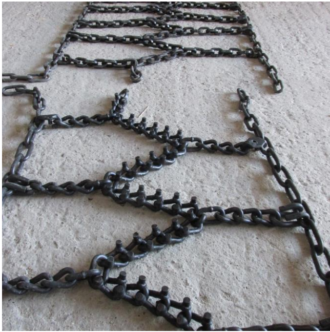
SS+8 усукан синджир

Веригите са изпитани при изключително трудни зимни условия и по кални терени. John Deere, Ponsse и Komatsu - трите най-големи фирми за специализирана горска техника, също осигуряват тракторите си основно с вериги OFA.