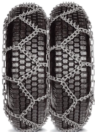
Модел SS + 8 Модел SS/SS + 8