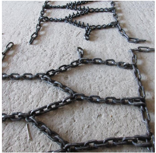
SS-NK+8 квадратен синджир