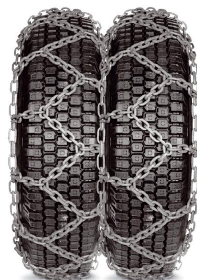
Модел SS-NK + 8 Модел SS/SS-NK + 8