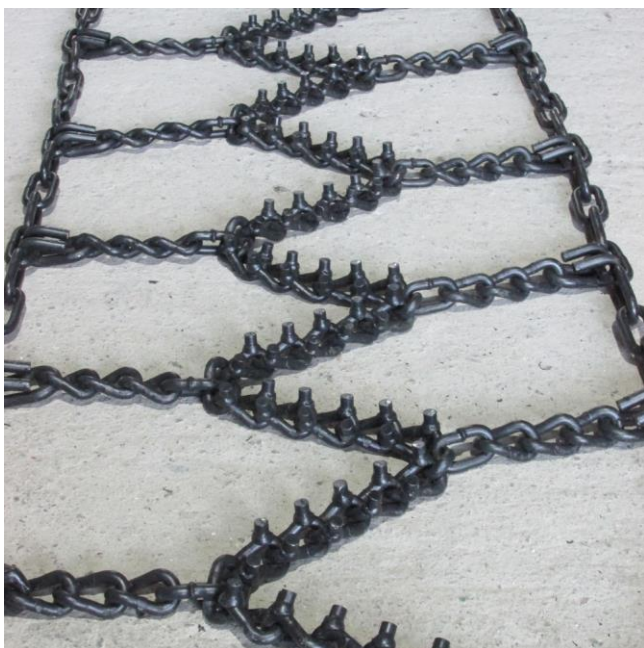
RS-9 ARMY усукан синджир